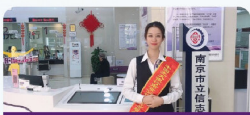
毕业生就职于光大银行南京分行