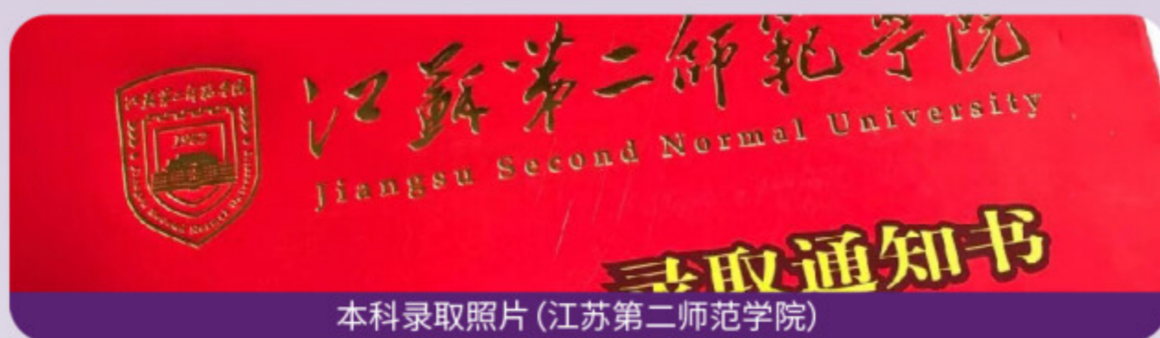
本科录取照片(江苏第二师范学院)