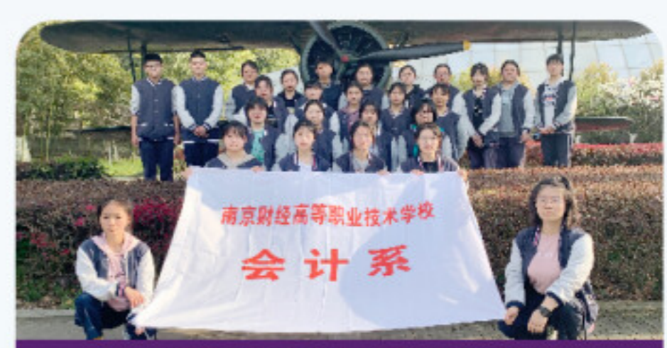
学生参加清明节纪念活动