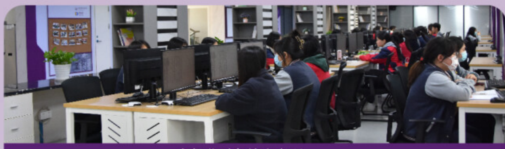
多行业财务综合实训