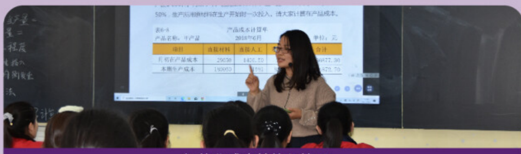
智能化成本核算与管理

专业核心课程:企业财务会计、智能化税费计算与申报、智能化成本核算与管理、会计信息系统应用、财务机器人应用、财务大数据分析、企业内部控制、财务管理实务。