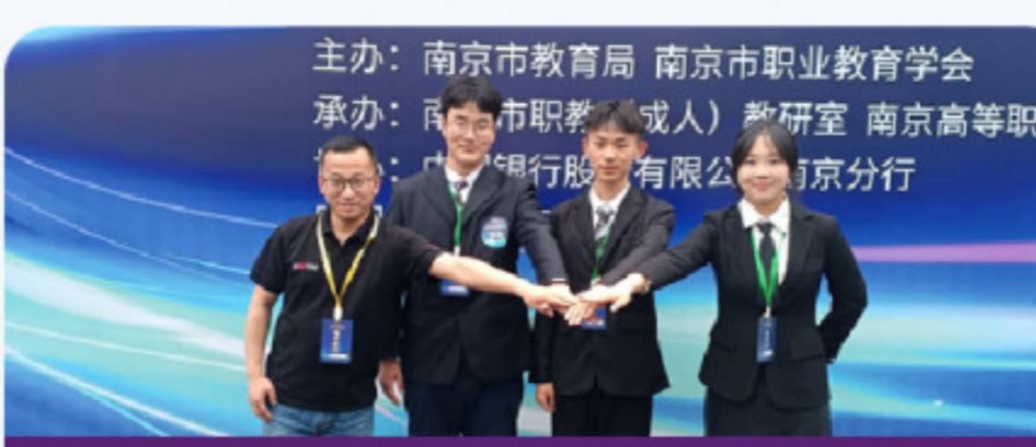
学生参加职业院校创新创业大赛