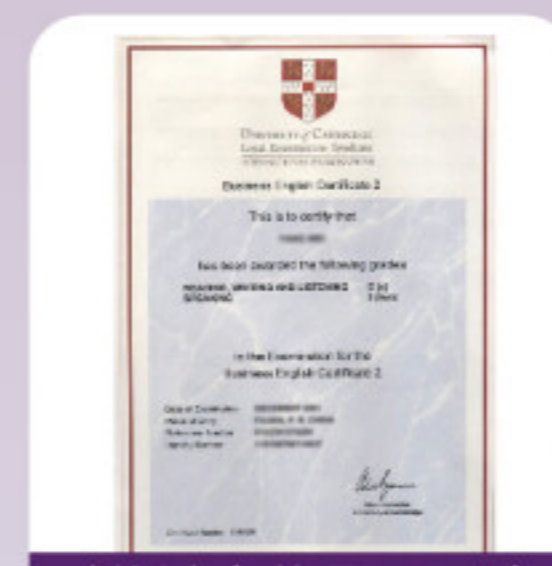
剑桥商务英语BEC证书

全国公共英语等级证书 剑桥商务英语BEC(初、中级) 秘书职业技能等级证书 普通话等级证书 计算机ATA职业技能证书