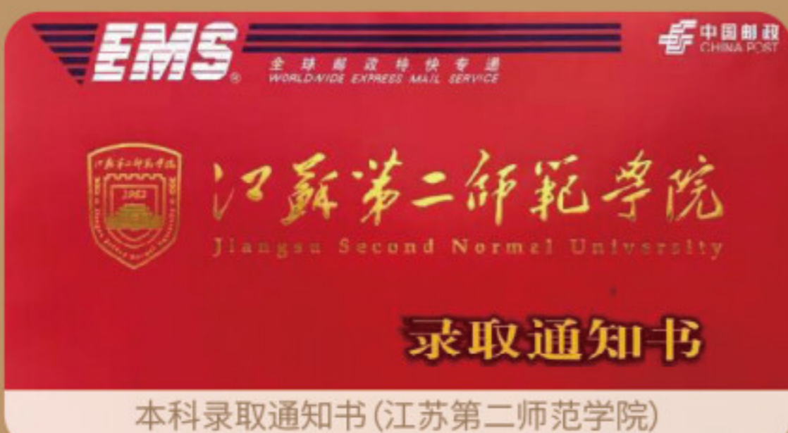
本科录取通知书(江苏第二师范学院)

1.专转本(全日制本科):本专业学生五年级可参加专转本考试,可面向南京晓庄学院、三江学院、苏州城市学院、南京工业职业技术学院、金陵科技学院、淮阴工学院、苏州大学应用技术学院、南京传媒学院、盐城工学院、南通理工学院、南京航空航天大学金城学院、南京师范大学泰州学院、南京师范大学中北学院全日制本科升学。 2.中外合作办学:本专业学生四年级时可以选择中澳合作办学,通过考试后可前往澳洲莫道克大学进行本科阶段的学习,获得全日制本科学历。