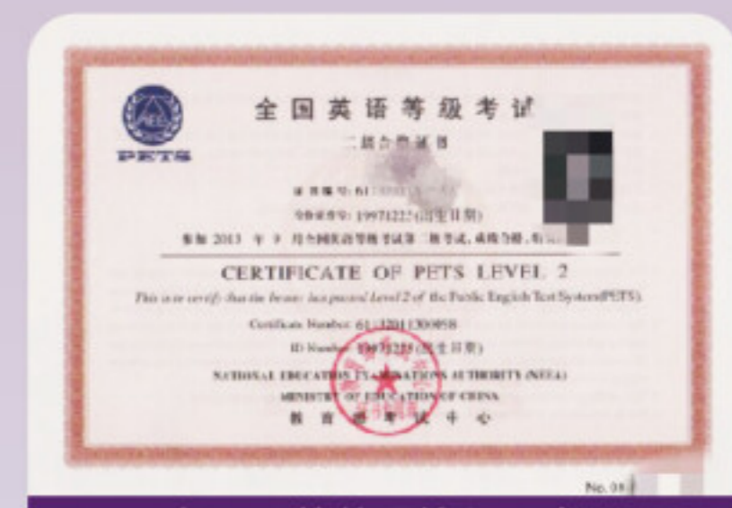
全国公共英语等级证书