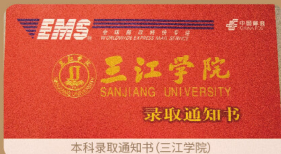
本科录取通知书(三江学院)