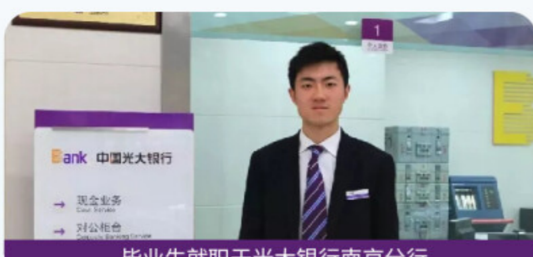
毕业生就职于光大银行南京分行