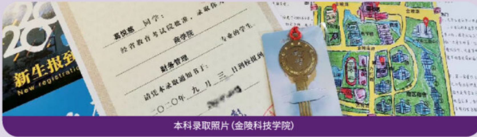
本科录取照片(金陵科技学院)

公办本科：金陵科技学院(财务管理专业)、江苏第二师范学院(财务管理专业)、淮阴工学院(财务管理专业) 民办本科：三江学院(财务管理专业)、苏州大学应用技术学院(会计学专业)、南京师范大学泰州学院(财务管理专业) 中外合作办学：澳大利亚WAIFS学院、莫道克大学、韩国崇实大学