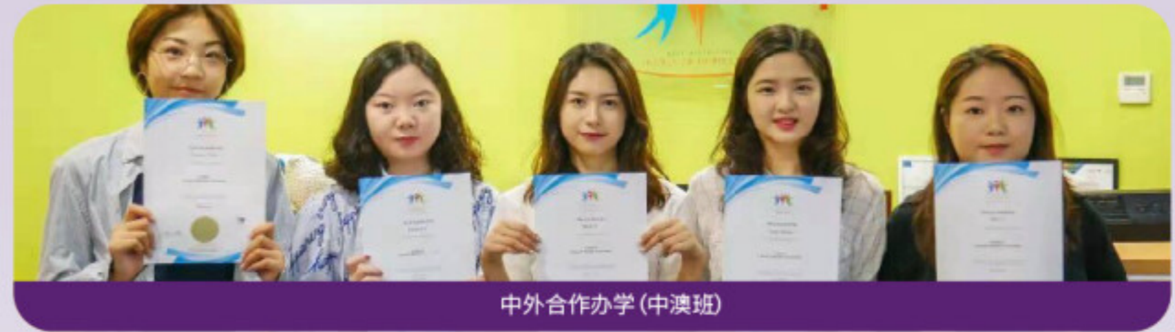
中外合作办学(中澳班)