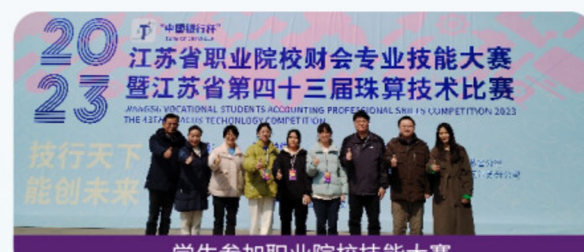
学生参加职业院校技能大赛