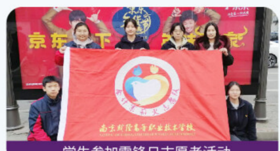
学生参加雷锋日志愿服务活动